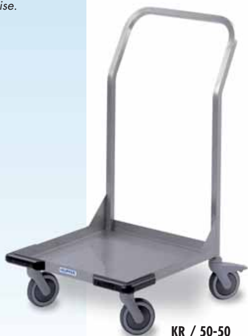
KR / 50-50