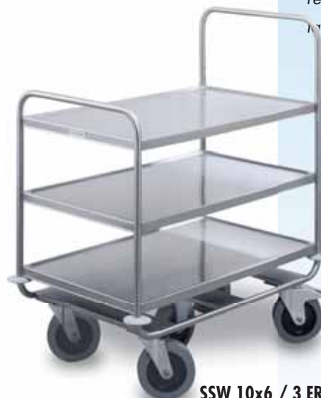
SSW 10x6 / 3 ERGO