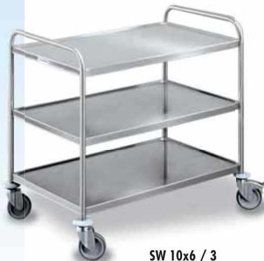
SW 10x6 / 3