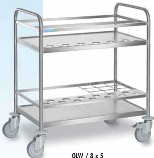
GLW / 8 x 5

La solution idéale pour tenir à disposition et transporter les ustensiles de travail et les épices.