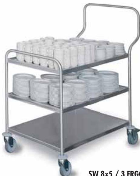
SW 8x5 / 3 ERGO

Une solution individuelle que HUPFER® vous offre c'est le modèle ERGO de la gamme de chariots de service. En utilisant les connaissances les plus nouvelles de la manutention ergonomique on a développé des modèles de chariots de service pour des différentes utilisations qui ne protègent pas seulement le matériel mais aussi le personnel. Ainsi la logistique en restauration est facilitée et le résultat opérationnel est amélioré.