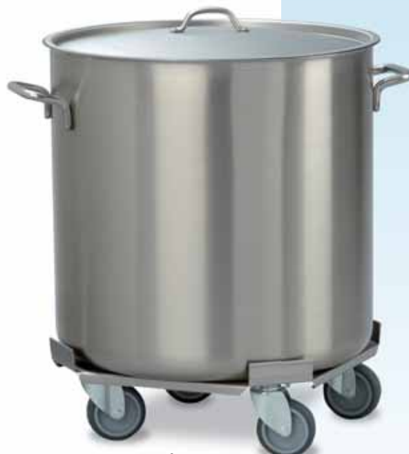
BHR / 50 SF

L'élimination rapide et correcte des déchets et des restes de la production est garantie par la poubelle de HUPFER®.