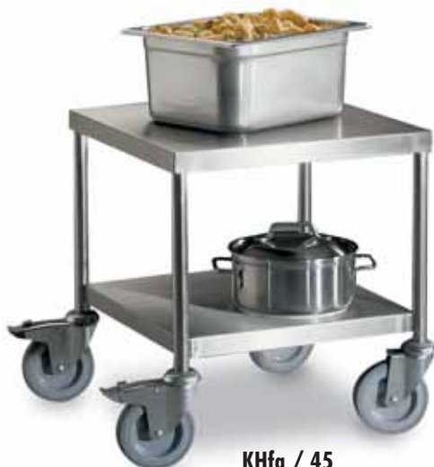
KHfa / 45