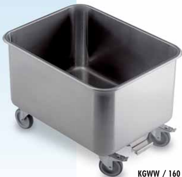
KGWW / 160

Le chariot lavage légumes – un produit indispensable pour chaque cuisine industrielle qui attache de l'importance à la production de fraîcheur dans la propre maison.