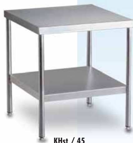
KHst / 45