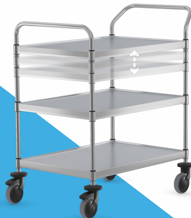
Stabile Klemmverbindung und starke Schweißnähte für maximale Traglast

weniger Transportvolumen durch den Flatpack-Karton